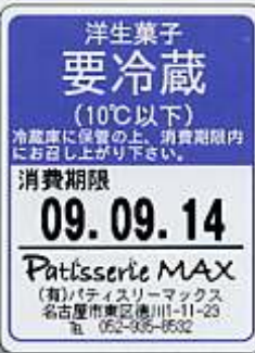
〈プレ印刷サンプル例〉 楽らくラベルProで作成したレイアウト例です。